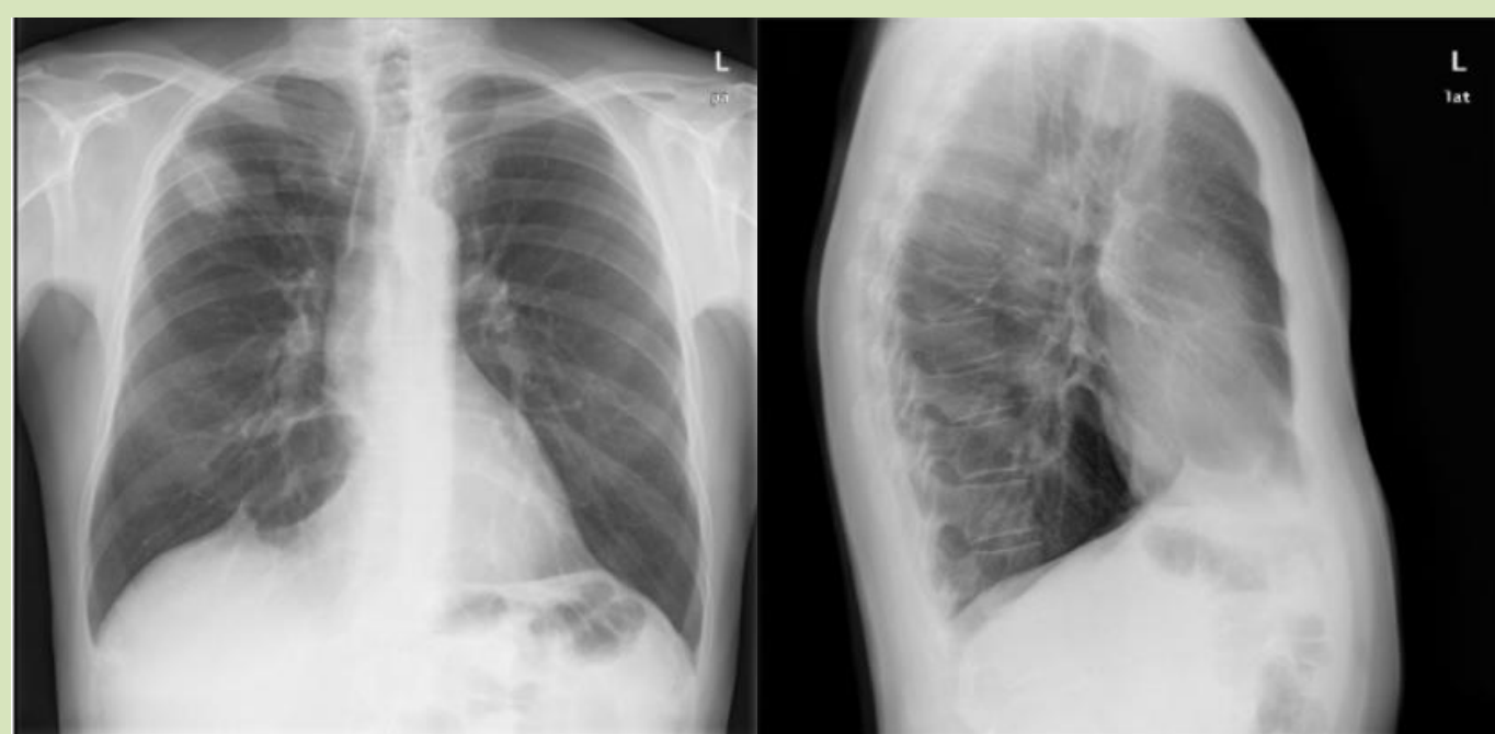
Nódulo pulmonar LSD 4x3 cm.

Iniciamos antibioterapia con Levofloxacino.